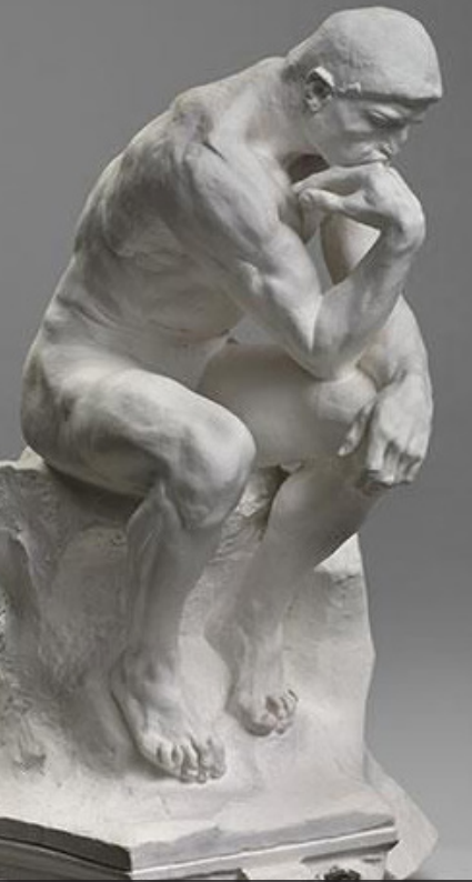
Auguste RODIN, Penseur sur chapiteau, plâtre, Musée Rodin, Paris, France

ENGIE Cofely a le plaisir de vous convier à l'évènement